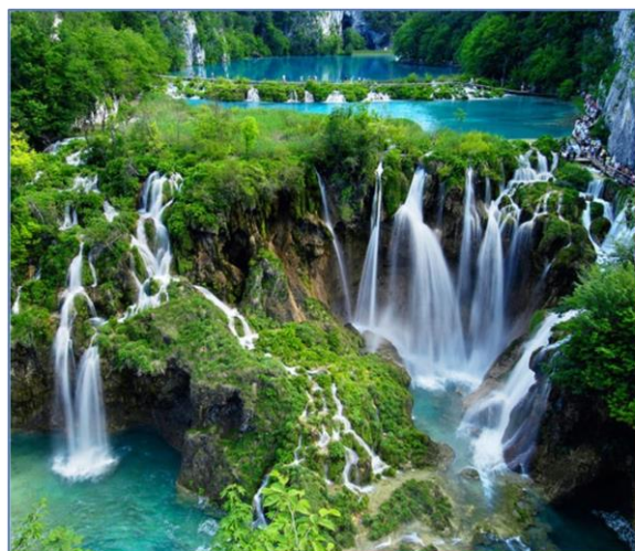
(上列圖片為第十一天行程—杜布洛尼克古城及第七天行程—十六湖國家公園)