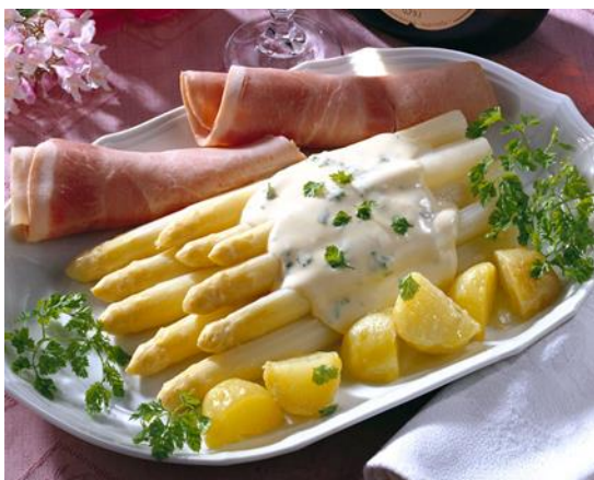
「皇室的饗宴」白蘆筍(每年四~六月限定)