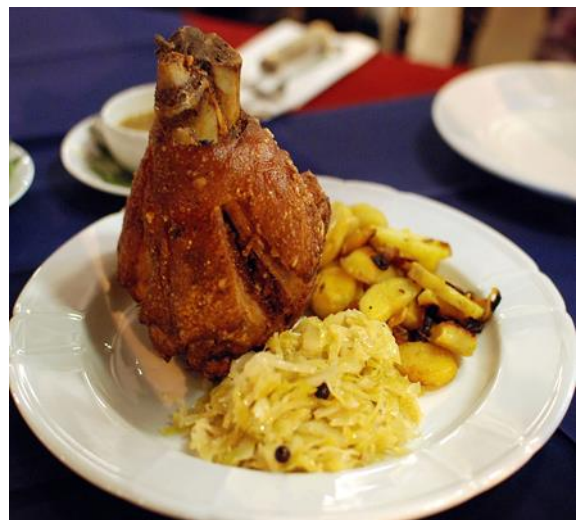
慕尼黑皇家啤酒屋豬腳大餐饗宴