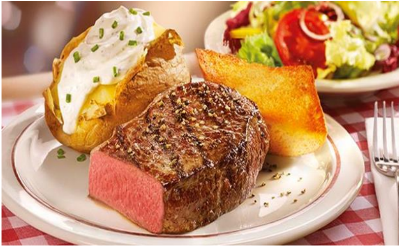
柏林 Block House 肋眼牛排