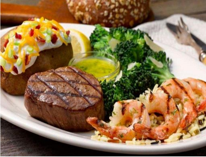
惜別晚宴萊茵河酒鄉安格斯牛排饗宴