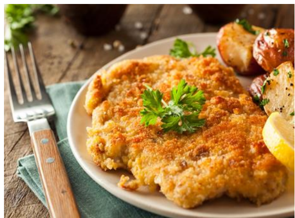
薩克森 Schnitzel 豬排