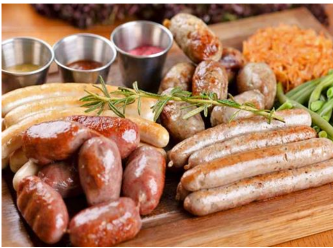
道地風味的巴伐利亞香腸美饌