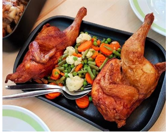
鮮美多汁的德式烤雞風味餐